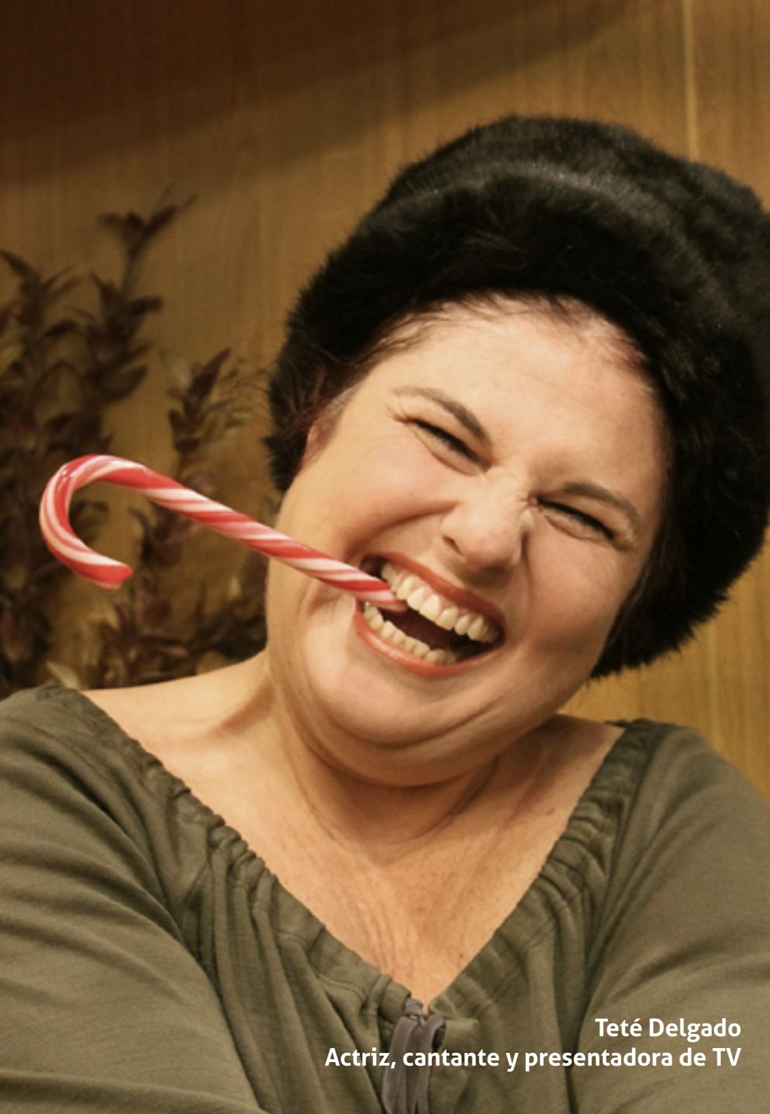
Teté Delgado Actriz, cantante y presentadora de TV