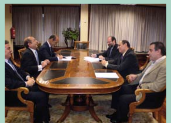
Momento de la firma del convenio en la entidad.

ferentes, tanto en crédito (anticipo facturación a euribor de mes -1, préstamos personal a euribor anual + 1, crédito a euribor de mes + 0,5), como en ahorro e inversión (cuenta especial farmacia, cuenta remunerada a euribor mes -1 o -0,5...).