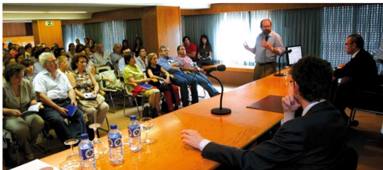
Una sesión explicativa de la implantación de e-receta celebrada en junio en la sede viguesa del Colegio.

Las fechas y áreas de implantación irán coordinadas con el Servizo Galego de Saúde, ya que es necesario que las consultas médicas asuman