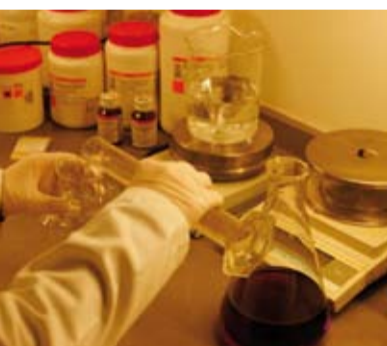
Aumenta el número de análisis de agua.

El Centro de Información del Medicamento (CIM) de Pontevedra ha adelantado que en este ejercicio se detecta un aumento de las consultas de tipo administrativo.