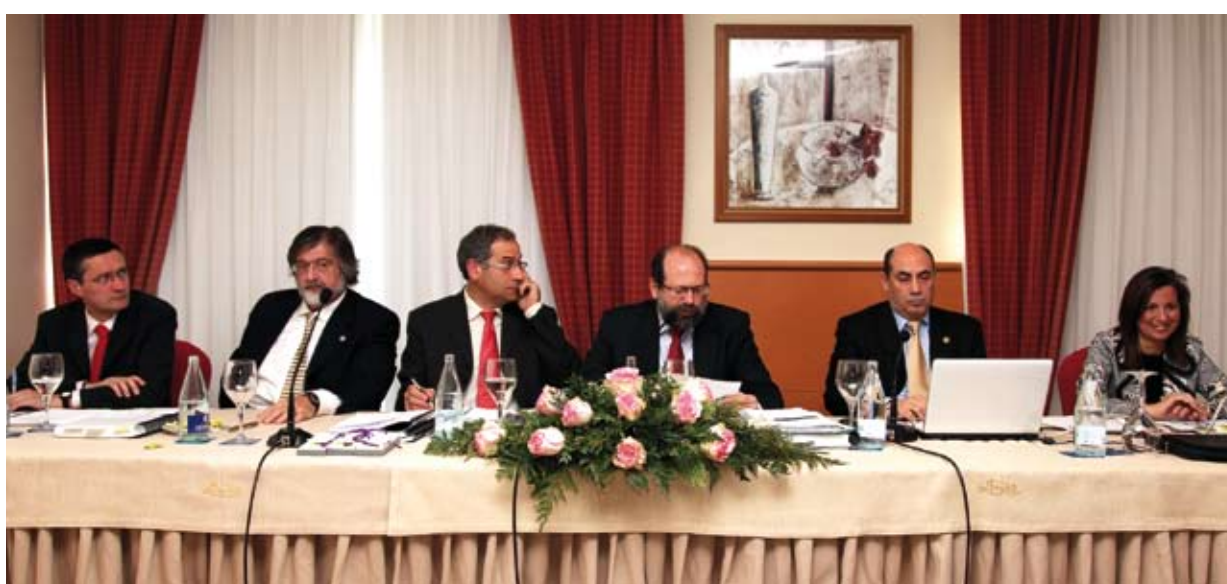
Arriba, asistentes a la asamblea anual del Colegio celebrada en A Toxa y los miembros representantes de la Junta colegial.