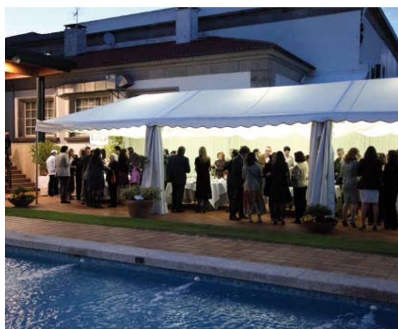
Imagen del cóctel previo a la cena de fraternidad en instalaciones del Hotel Louxo.