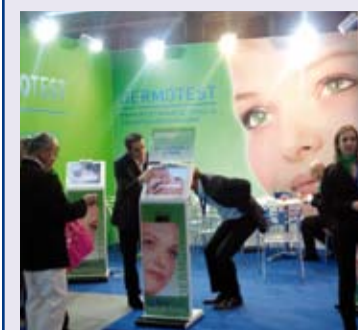
Un stand, en la pasada edición.

El certamen Infarma 2009 afina ya los últimos preparativos para abrir las puertas del 11 al 13 de marzo en el Palacio de Congresos de Barcelona.