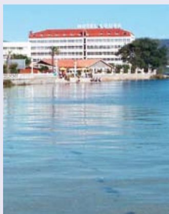
Vista del Hotel Louxo, en A Toxa

Se convoca a los colegiados en la isla de A Toxa