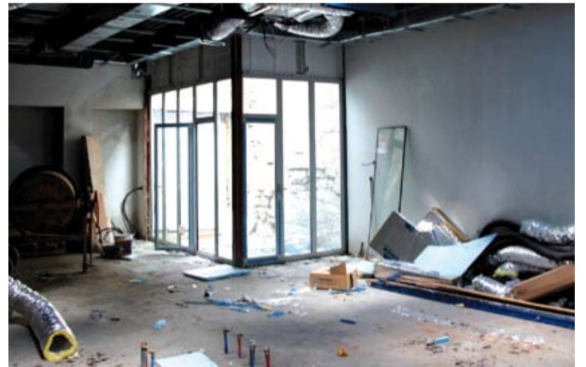
Arriba la nueva terraza. Abajo, el área que ocupaba el laboratorio.

Aunque las obras continúan, estas se han ralentizado y ahora solo trabajan unos pocos obreros, por lo que se está estudiando la suspensión del encargo firmado, la liquidación de responsabilidades por incumplimiento de contrato y la contrata a otro grupo que garantice su entrega lo antes posible.