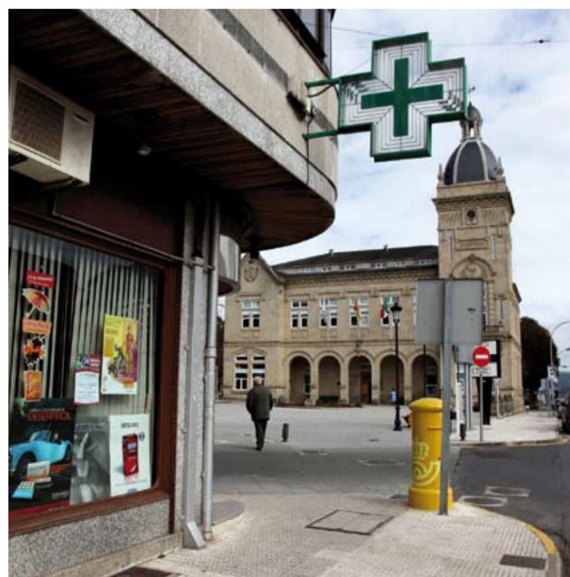
Una de las farmacias de A Estrada, que será el próximo municipio con la e-receita.

En cualquier caso, se espera que la e-receita esté plenamente expandida al ámbito colegial del COF en este ejercicio.