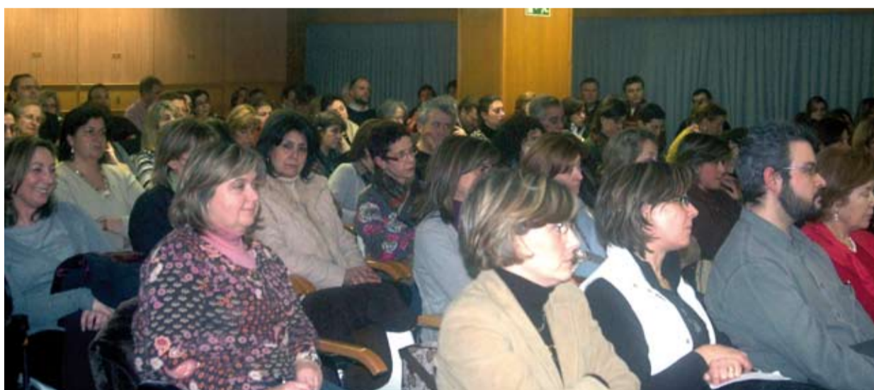
Asistentes a la asamblea del Colegio celebrada en la sede de Vigo.

En el concurso de farmacias, se produjo una revocación de algunas de las